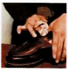
【靴磨きがったん】 靴ん磨き(防府) @gatan0220