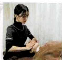
【snow drop】 小顔骨格矯正(山口) @_snow.drop