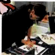
【SHO CAFE】 書の書き下ろし(下松) @shocafe330