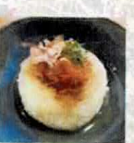
【ROOTS.】 焼きおにぎり(徳地) @roots.tokudi