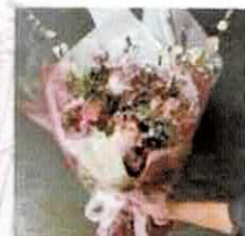
【ライクロフラワー】 ドライフラワー(防府) @tacoogama