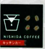
【NISHIDA COFFEE】 コーヒー(山口) @nishida_coffee