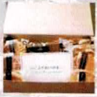
【KUROCAFE】 焼き菓子(北九州) @kurocafe4869