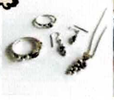
【K.O.SILVER】 シルバーと真鍮のアクセサリー(山口) @kosilver950