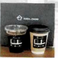
【ながさきでんか】 自家焙煎コーヒー(防府) @kura_think.nagasakidenka