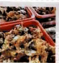
【ギンチク】 焼肉丼(防府)