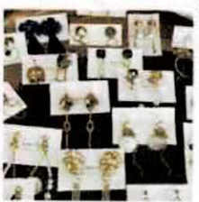
【ma-lien】 アクセサリー(防府) @ma_lien2022