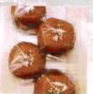
【たなか遊花堂】 和菓子(防府) @tanaka.yuukadou