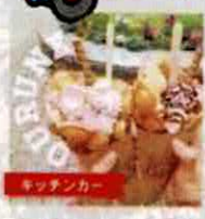
【Qurune】 クレープ(防府) @qurune_kitchen_car