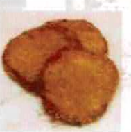
【岡虎】 練物(防府) @okatora_shiosai