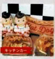
【PICO DINER】 ホットドッグ(山口) @picodiner_