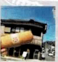
【ゴトウパン】 パン・焼き菓子(山口) @gotoupan