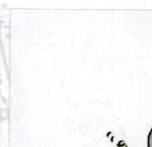
【竹細工】 竹を使ったあそび