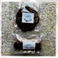
【おやつの鯨鯨】 焼き菓子 オリジナルグッズ・植物(山口) @geigei_oyatsu