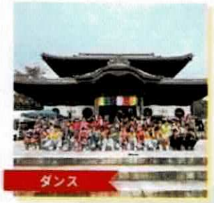
ダンス 【SESAMEY Street Dance School】 @sesamey_dance