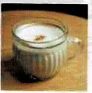
【和漢茶舗いくもや】 薬膳茶 @ikumoya