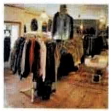
【LOCUS】 服(山口) @locus.2020