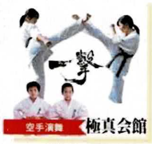
空手演舞 極真会館 【極真会館】 @karate.aio.hohu