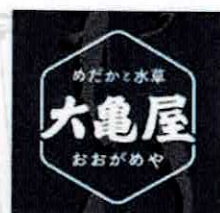
【大亀屋】 めだかすくい(北九州) @oogameya