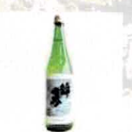
【竹内酒造場】 日本酒試飲・販売(防府) @takeuti_shuzoujiyo