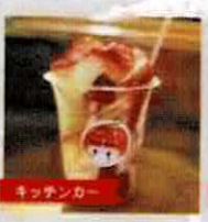
【りんご屋人の嫁ぎ先】 りんご飴 @apple_kitcar